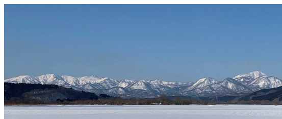
町内から見える山々

先日の全校集会で、子どもたちに節分の話をしました。今年は暦の関係で124年ぶりに2月2日が節分となるそうです。季節を分けると書く節分、もともとは各季節ごとに行っていたようですが、江戸時代あたりから冬の節分が旧暦で節分を大晦日、立春を元日としていたこともあって、現在のように年に一度イベントとして行うことが定着していったようです。毎日寒い日が続いていますが、最近日は日の出も6時台に、知内川もオオワシやオジロワシが去り、ちらほらと白鳥が帰ってきています。木にも固く結んだ新芽が見え、季節が歩みを進めているのを感じます。学校も、3年生は巣立ちの春が近づき、それぞれが進路実現に向けて今が頑張りどきと捉え学習に精を出しています。すでに何名かは進路が決まっている生徒もおります。学習のまとめに加え、面接練習も始まっています。それぞれの願ひが叶うよう、教職員一同全力で応援します。1・2年生については、委員会を含めた生徒会活動も軌道に乗り、部活動についても2年生が1年生の様子を丁寧に見取り、具体的な言葉で指導している様子なども見られ、頼もしい限りです。それぞれの学年のまとめの時期、この一年で積み重ねてきた成果をしっかりと確かめ、次の学年へとつなげていけるよう支援して参ります。