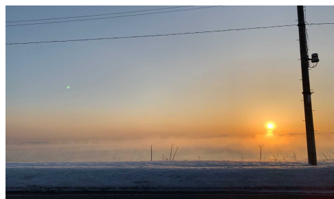
早朝の中の川地区

今年度は、コロナ禍の中多くの学校行事を通常通り行うことができませんでした。保護者・地域の皆さまには、ご来校いただく機会がなくなり子どもたちの姿を見ていただくことができなかつたのが残念であり、大きな課題として残りました。評価の中にも工夫・改善をすべきということが数字に表れており、次年度はコ