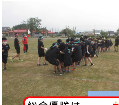
キャプテンの激走!