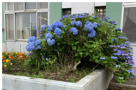
見頃を迎えた校舎前のあじさい

4月からコロナウィルス感染症の影響で変則的な学校生活を余儀なくされた一学期ですが、皆さまのご支援とご協力のおかげで、無事終了することができました。ありがとうございます。夏季休業につきましても、例年より短く明日から17日までの13日間となります。子どもたちは、元気に学校生活を送っていましたが、イベントがなくなることや生活様式の変化から、不安に思ったりいつも以上に疲れを感じているかもしれません。日常生活の中で緊張へ変化が続いたときこのような心や体の状態になるのは、誰にとっても自然なことです。この休業中、次のような関わりがお子様の回復の一助になるかもしれません。